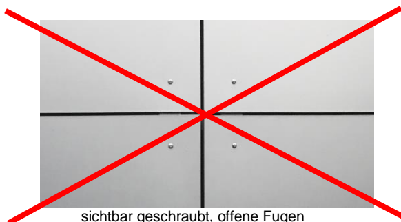
sichtbar geschraubt, offene Fugen